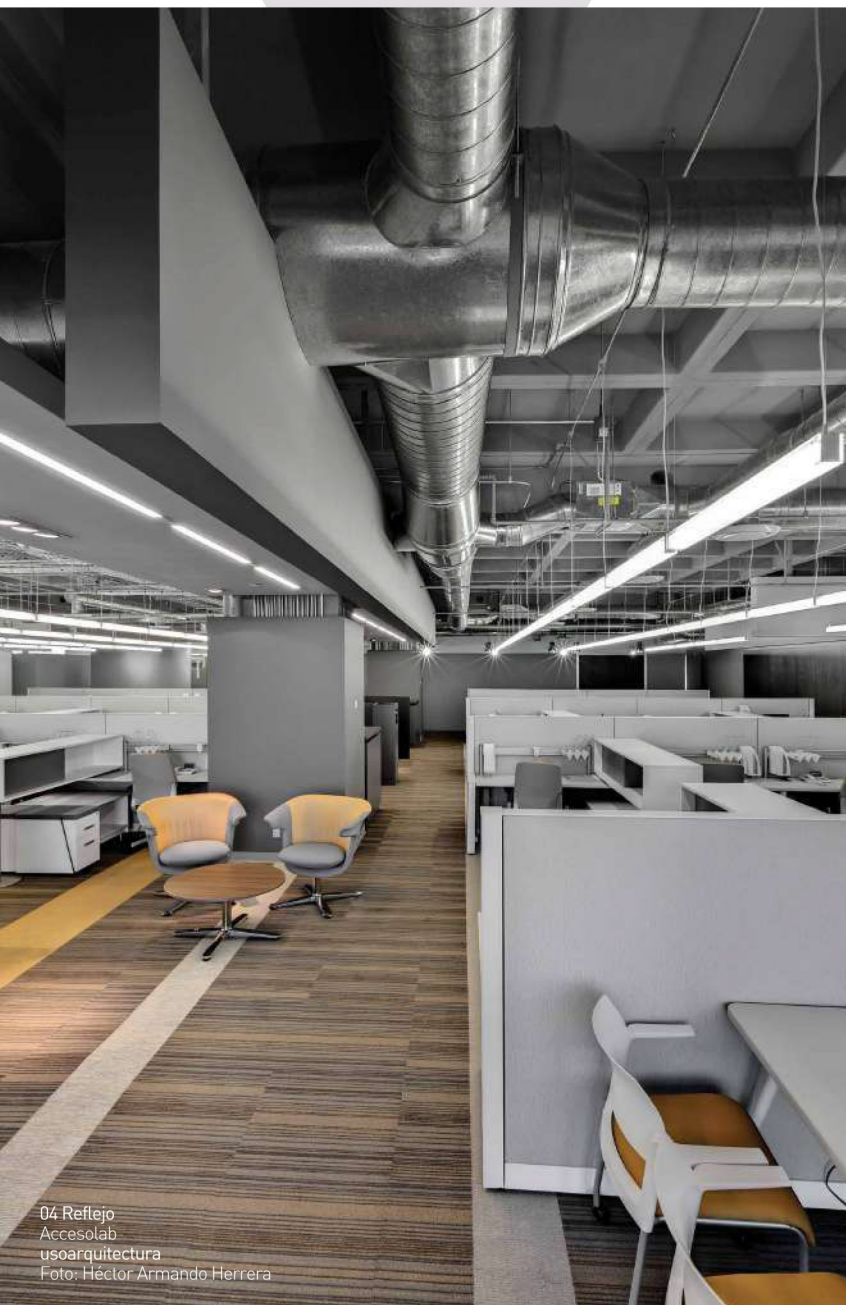
04 Reflejo Accesolab usoarquitectura