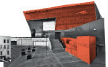
Corporativo Banorte Monterrey