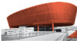
Call Center Querétaro