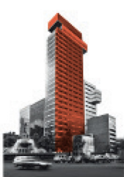
Edificio Reforma Diana

HABITACIONAL CASA DEPARTAMENTO LOFTS OFICINAS PREVENTA PROPIEDAD FRACCIONAL TERRENOS CASA DE PLAYA