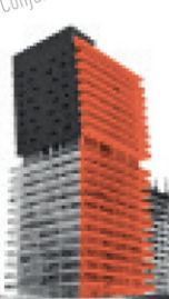
Central Park Querétaro