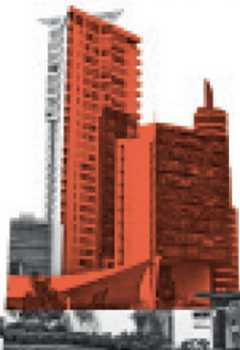
Central Park Querétaro