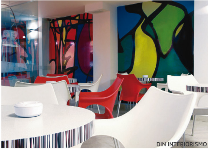
Intervención en 2011 del hotel Howard Johnson Centro Histórico, DF.