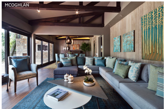
Sala del proyecto residencial Casa Laurel.

Proyectos: Corporativo IXE, rediseño de imagen de Scotiabank, imagen de Farmacias Dermatológicas, centros de distribución de calzado Andrea.