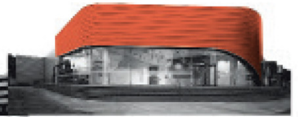
Centro de contacto DF